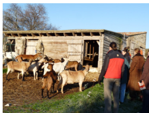
Le troupeau comme support de travail