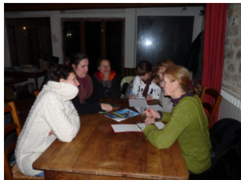
Echanges enseignants/agriculteurs en salle