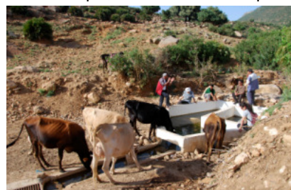
Visite dans un village du secteur du Tlemcen

Dans ces différents pays, les programmes scolaires abordent bien l'éducation à l'environnement mais il semble capital pour ces animateurs que ces clubs environnement perdurent car contrairement à celles utilisées en classes, la méthode de pédagogie active utilisée dans ces clubs fait ses preuves. Il serait donc plus question de mettre en place des dispositifs type éco-école permettant de bâtir des projets d'établissement qui intégreraient la dimension environnementale, touchant ainsi l'ensemble des élèves.